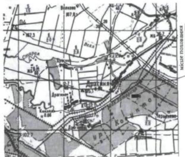
Мал.2. Зразок карти-схеми поховання з прив'язкою до місцевості